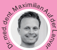
Unser Experte von Zahnfokus Düsseldorf, mehr Infos: zahnfokus.de