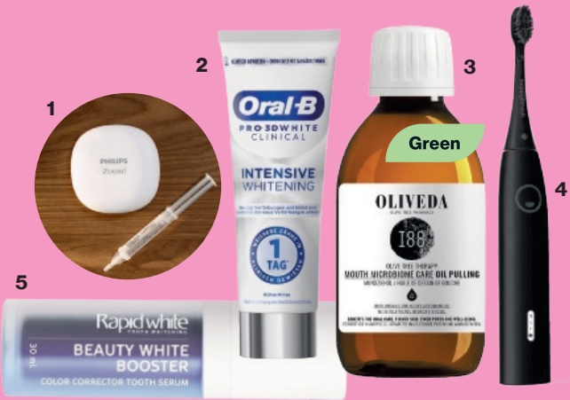
1 Individuelles Bleaching-Set: „Philips Zoom! Take Home“ von Philips, ca. 400 €, bei ausgewählten Zahnärzten • 2 Wirkt wie ein Magnet und löst Verfärbungen: „Intensive Whitening“ von Oral-B, 75 ml, ca. 7 € • 3 Zum Ölziehen: „188 Mouth Microbiome Care Oil Pulling“ von Oliveda, 200 ml, ca. 40 € • 4 Schallzahnbürste: „Eco Vibe 3+“ von Happybrush, ca. 70 € • 5 Mit Langzeit-Whitening-Technologie: „Beauty White Booster“ von Rapid White, 30 ml, ca. 10 €

White-Strips, aufhellende Zahnpasta oder Whitening-Kits – das Angebot für Home-Bleaching-Produkte boomen wie nie, sind allerdings laut Dr. Auf der Lanver mit Vorsicht zu genießen: „Beim Wunsch nach weißen Zähnen ist der Weg zum Zahnarzt unumgänglich. Nur hier findet man die für seine Zähne schonendste Methode.“ Das ärztlich beaufsichtigte Home-Bleaching „Philips Zoom! Take Home“ von Philips ist etwa eine wirkungsvolle Methode. Nach einer zahnärztlichen Untersuchung erhält der Patient Schienen mit einem individuell dosierten Bleaching-Gel. Dieses enthält ACP (amorphes Calciumphosphat), was den Zahnschmelz schützt, den Glanz verbessert und die Empfindlichkeit verringert. Danach trägt man die Schiene zwei Wochen tagsüber oder nachts. Das Ergebnis? Wahnsinn! (Kosten: ca. ab 400 Euro). Bei einem Blick in die Zukunft erklärt der Zahnarzt, dass LED- und Laserbasierte Systeme immer präziser werden und eine komfortable, effektive Aufhellung versprechen, ebenso wie „Smart Bleachings“, wobei KI-gestützte Geräte genutzt werden, die die Zahnfarbe in Echtzeit analysieren und den Aufhellungsprozess individuell anpassen. ■